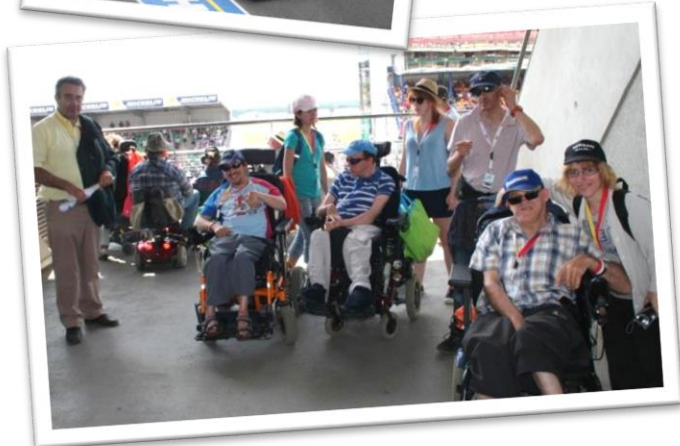
24 heures du Mans, aux premières loges, invités par l'Ordre de Malte et l'Automobile Club de l'Ouest