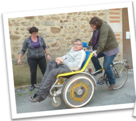
Balades à vélo sous le soleil

Petit tour en images sur quelques temps forts vécus depuis le printemps dernier.