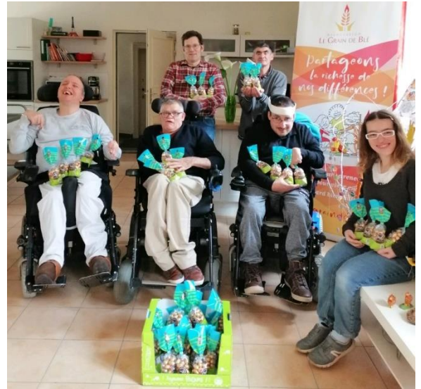
Ateliers cuisine (avec toutes les précautions d'usage), par exemple pour préparer les petits poussins du repas de Pâques... Une joyeuse fête, avec la surprise de recevoir en cadeau plusieurs cartons de chocolats ! (Un grand merci au magasin Super U Libération Le Mans .)