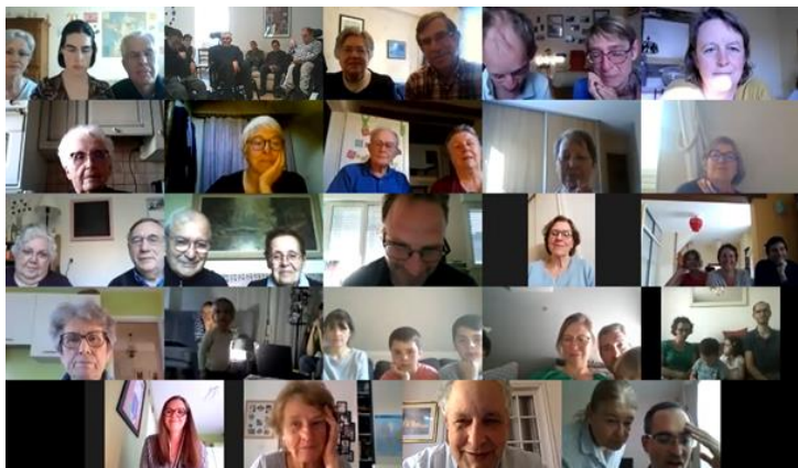
En visioconférence : familles, amis, paroissiens...

Article paru dans le journal Ouest France le 17 avril 2020