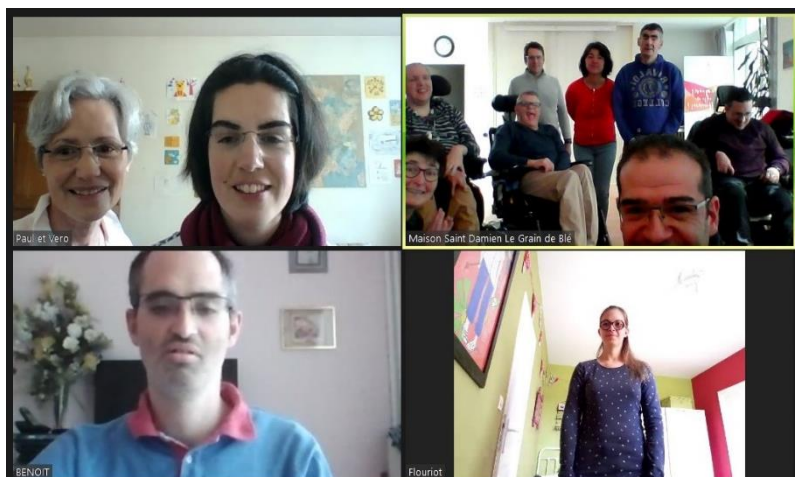
Karaoke et danse "en présentiel" mais sans se toucher...