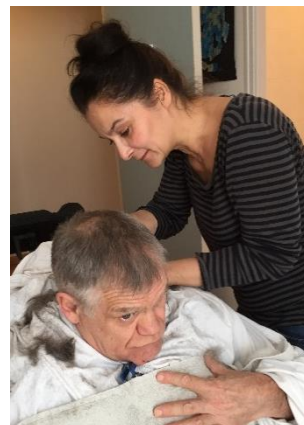
Séance de coiffure.