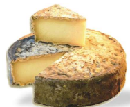
Tome des Bauges (1,1 Kg env.*) 18€ Petite tome au lait cru, affinée 5 semaines.