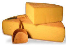
Gruyère de Margériaz (1 Kg*) 18€ Un goût fruité entre le Comté et le Beaufort.