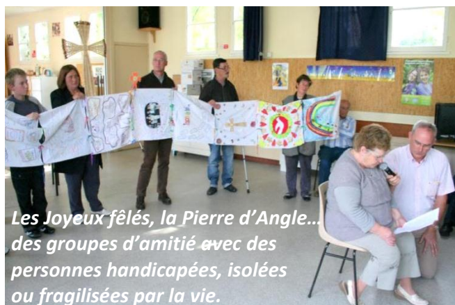
Les Joyeux fêlés, la Pierre d'Angle... des groupes d'amitié avec des personnes handicapées, isolées ou fragilisées par la vie.

Merci pour cette belle journée aux nouveaux amis que nous avons été très heureux de rencontrer !