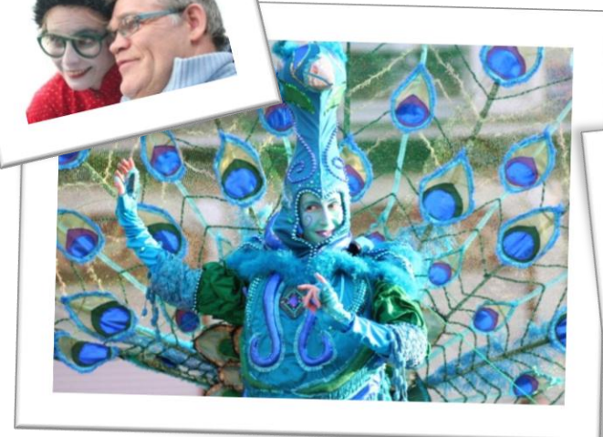
« Le Mans fait son cirque »

Toutes les photos sur www.legraindeble.fr