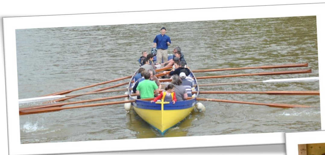
Ballades en bateau sur la Sarthe