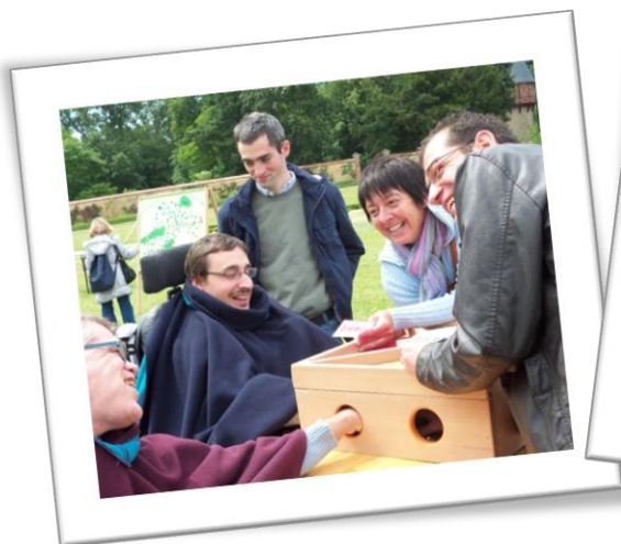
Fête du jeu

Quelques exemples parmi les sorties et activités vécues ensemble.