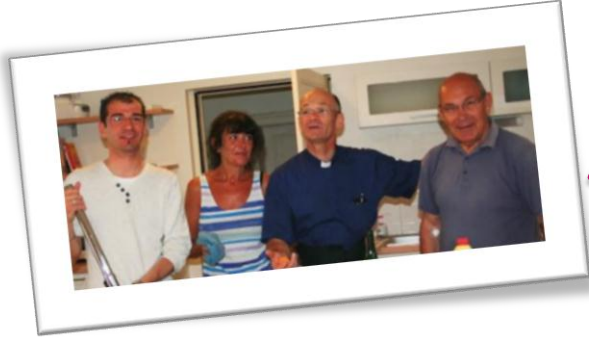
Grand ménage d'été Merci à nos amis bénévoles !