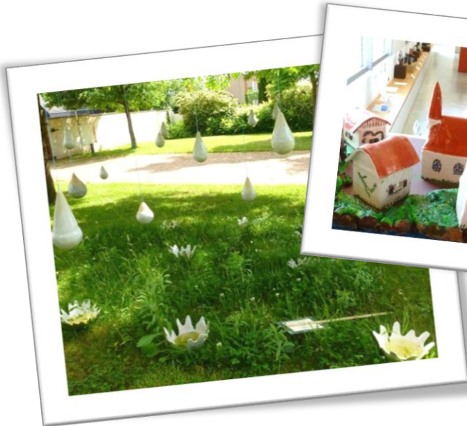
Exposition à Malicorne Dans le cadre du Festival Handi-Moi Oui !