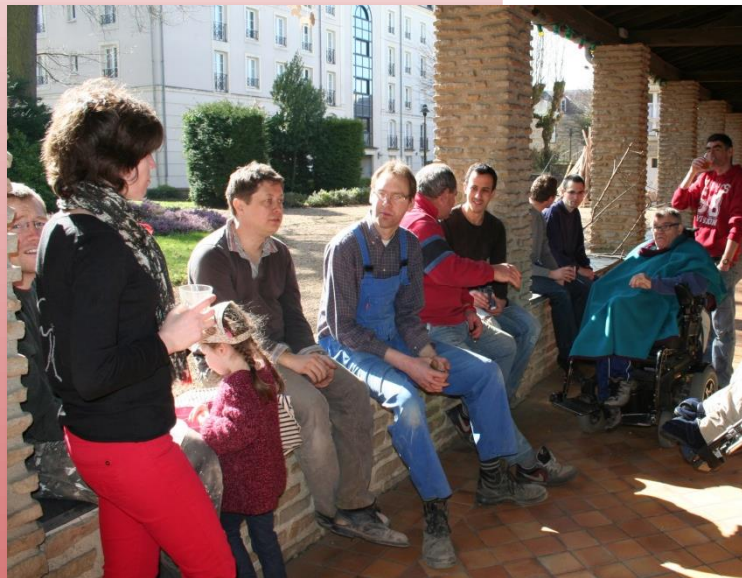
Avec des bénévoles du Grain de Blé, le 8 mars dernier, pour une journée de bricolage... ensoleillée !